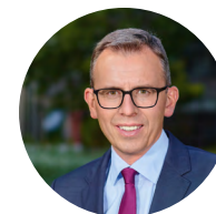
Sven Hinterseh Landrat Schwarzwald-Baar-Kreis